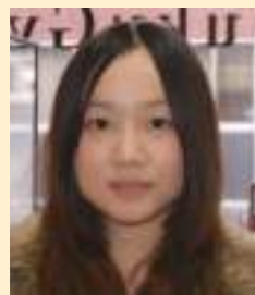
鄒さん (初級コース) 邹同学(初級班)

当时选择新宿御苑学院是父亲在日本的好友介绍。回顾一年多来的点点滴滴，我由衷地感谢他当初为我介绍了新宿御苑学院。这里的师资力量强大，老师工作认真负责，学习氛围良好。目前，我也为了理想的大学院所努力着。选择日本，选择新宿御苑学院，为了自己的梦想奋斗，FIGHT!!