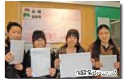
宿題提出デモック